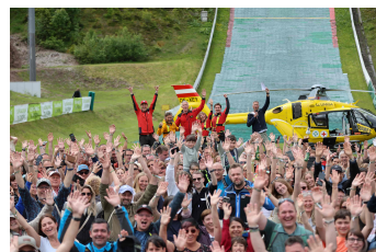
Bergretter-Fantag in Ramsau: Spektakuläre Show und hautnahe Begegnungen mit den Stars der ZDF-Serie.