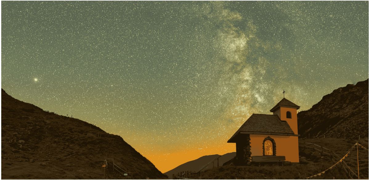
Beeindruckender Sternenhimmel über den Sölkälern – die Sölkpasskapelle unter der strahlenden Milchstraße beim Sonnenaufgang.