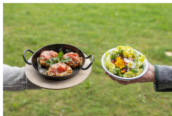
Genuss pur auf der Alm – Überbackene Kaspressknödel als Teil der Almkulinarik by Richard Rauch.