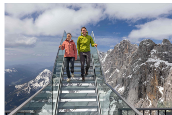
Mutige Schritte Richtung Himmelsleiter am Dachstein. Sie bietet Nervenkitzel und atemberaubende Ausblicke.